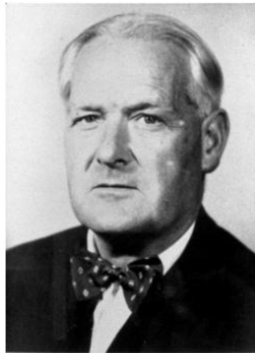
Sir Austin Bradford Hill (1897-1991)